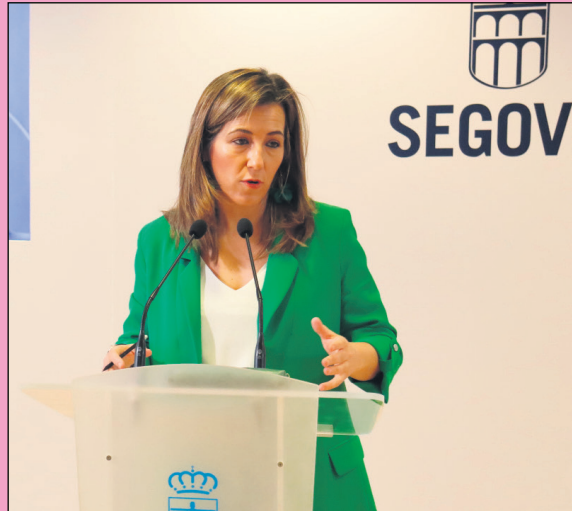
ASGEM cuenta actualmente con cerca de 200 personas asociadas