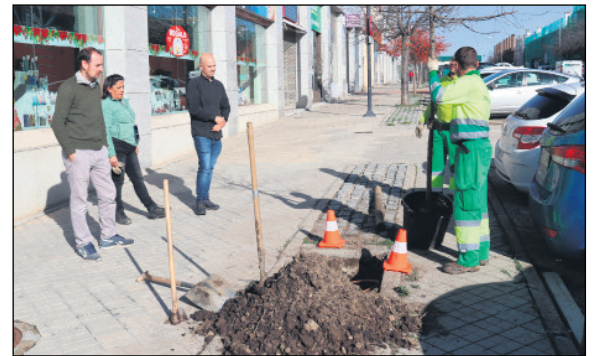
Reposición de un alcorque en el barrio de Nueva Segovia

Los servicios municipales realizaron un mapeo de todos los alcorques del municipio para identificar aquellos en los que era necesario reponer arbolado. En esta tarea colaboró la asociación ambientalista Segovia por el Clima.