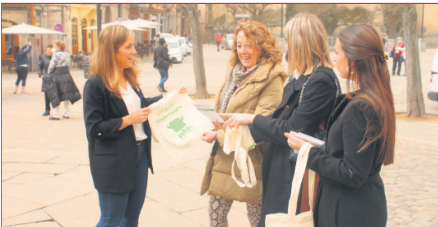
El Ayto ha impulsado varias campañas informativas, entre ellas "Consumo Responsable, Consume Segovia"

La concejalía de Servicios Sociales invirtió el pasado año 87.000 € para seguir acondicionando el cementerio municipal, como ya hizo en 2021. Se han acometido actuaciones de pavimentación y reparación en dos de los patios interiores para mejorar la accesibilidad en esta instalación. También se ha arreglado el antiguo osario y se ha creado una nueva red de recogida de aguas pluviales.