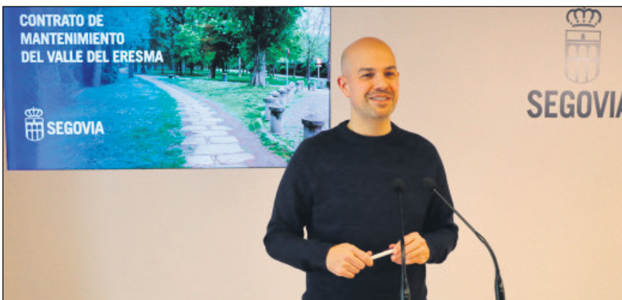
La masa salarial media anual se fija en 227.306,81 €, con una superficie de mantenimiento de 227.890 m 2

La labor que llevan a cabo las entidades de nuestra ciudad es fundamental de cara al sostenimiento y promoción de la ciudadanía más vulnerable. Mediante esta convocatoria de subvenciones se busca favorecer la profesionalización de los proyectos y el impacto positivo de los mismos en el municipio.