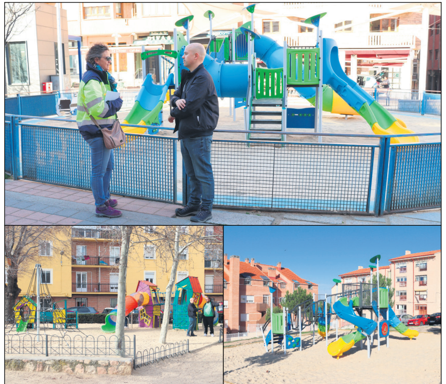
Áreas infantiles de José Zorrilla (arriba), San Lorenzo (izquierda) y El Palo-Mirasierra (derecha)

La concejalía ha sustituido los elementos de juego por otros completamente nuevos, más completos y más seguros. También se ha renovado el suelo mediante su limpieza y aportes de