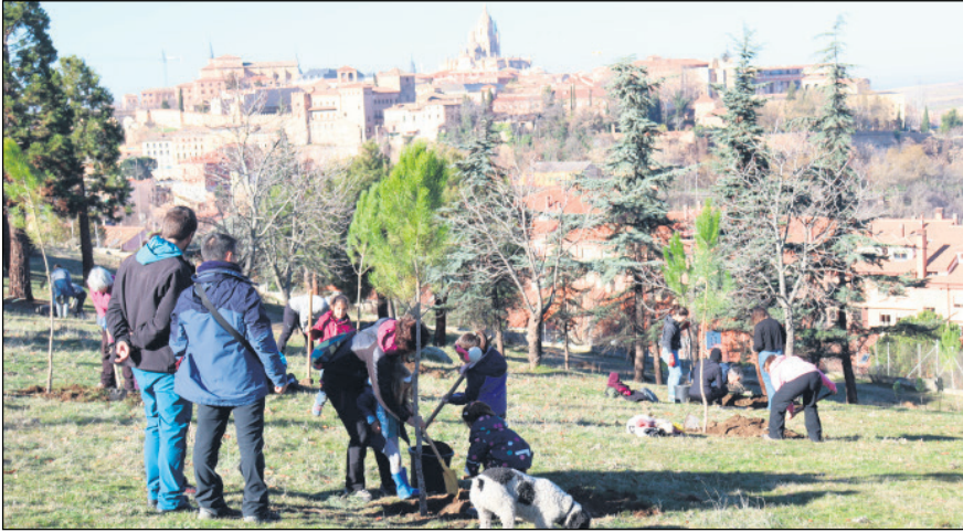
Decenas de personas participaron en esta jornada de plantación colectiva